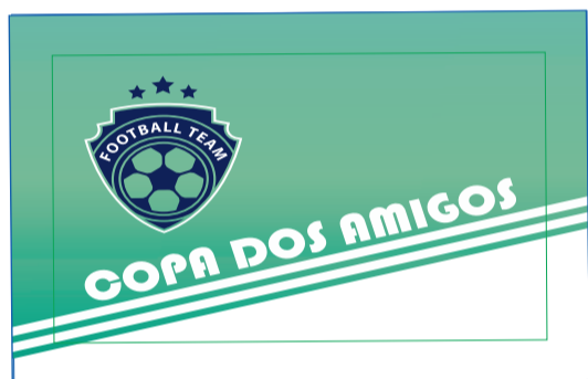
Página 01 Impressão